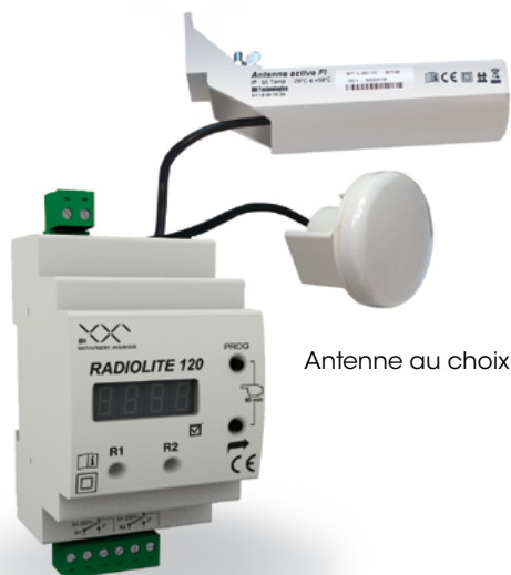
Antenne au choix

UN PRODUIT UNIQUE, FIABLE ET ECONOMIQUE.